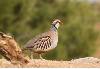
Rebhuhn / Steinhenne