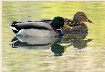
Ente / Mallard